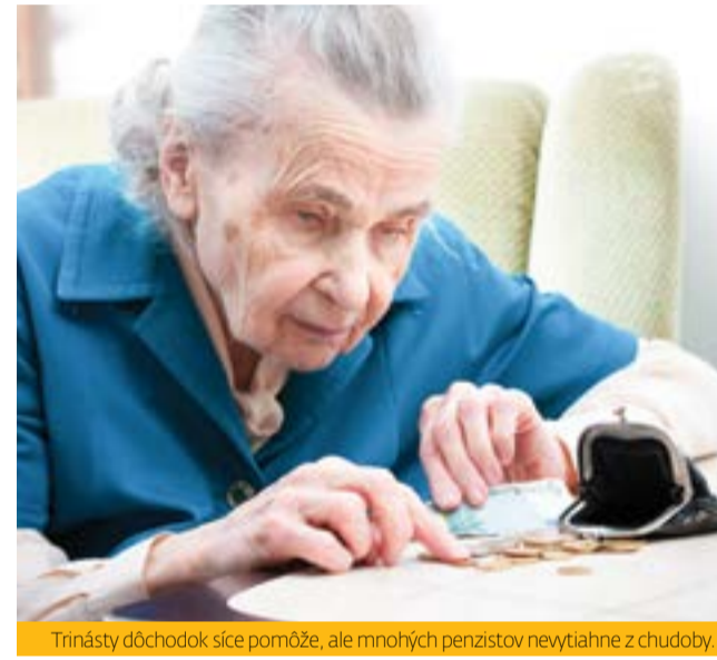
Trinásty dôchodok síce pomôže, ale mnohých penzistov nevytiahne z chudoby.

Vláda už riešenie má. Minister financií Igor Matovič prišiel s riešením, aby dôchodcovia dostali skôr vyplatené trináste dôchodky, na ktoré má rezort vyčlenené peniaze, a to už v máji alebo v júni. Má to byť kompenzácia za časovú nesúlad vplyvu dôchodcovskej inflácie na následnú valorizáciu dôchodkov. Systém 13. dôchodkov sa mení nebud. Ostáva založený na princípe, že najviac dostanú tí, ktorí majú svoje dôchodky najnižšie.