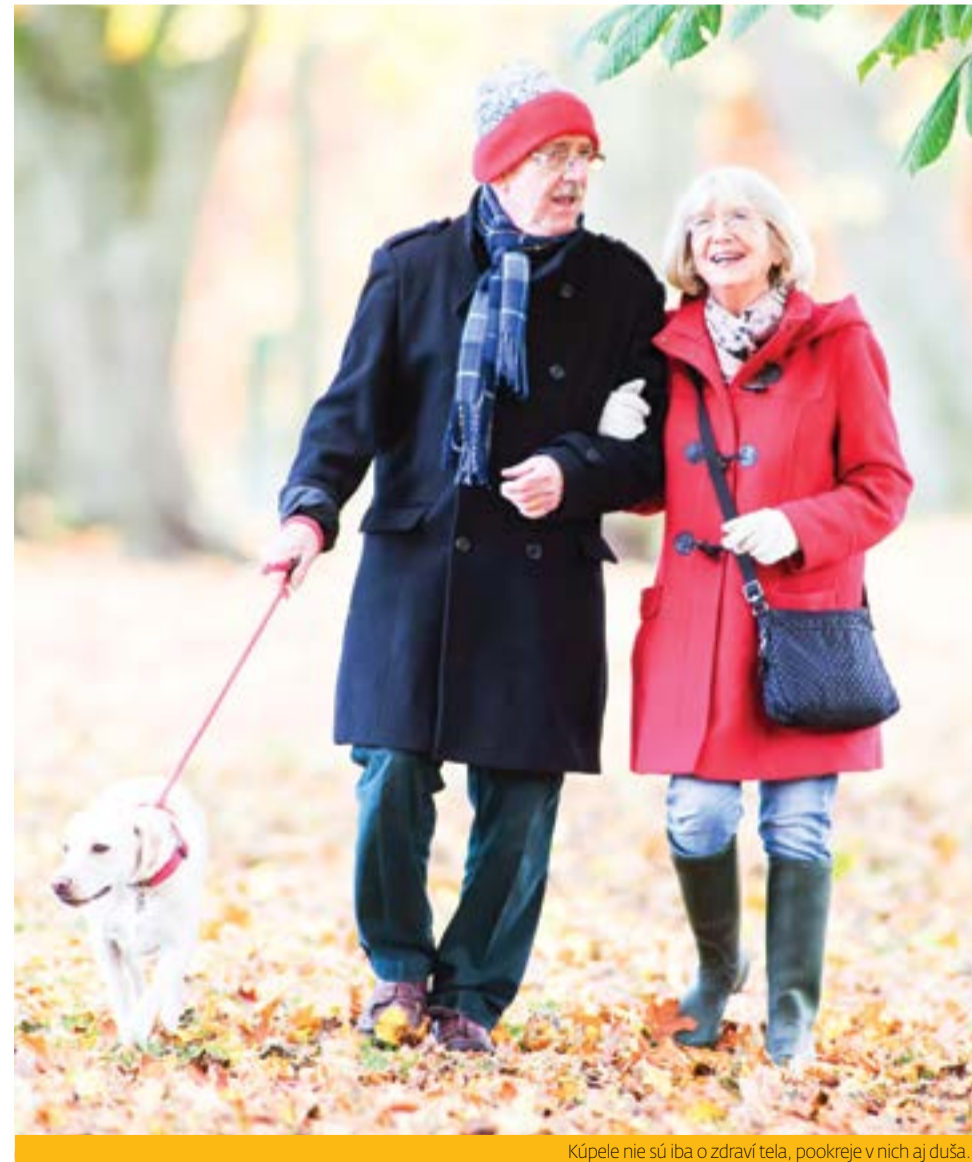
Kúpele nie sú iba o zdraví tela, pookreje v nich aj duša.

• stavy po operáciách srdcových chýb, • chronické ochorenia obehového systému, • niektoré chronické choroby tráviaceho ústrojenstva, • chronické ochorenia z po-